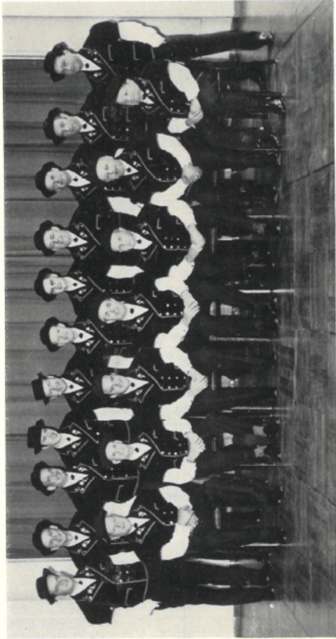
Jodlerklub Edelweiß Luzern 1969